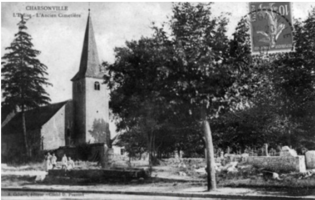
L'élargissement de la route côté place a été réalisé Le presbytère est démoli et son jardin a disparu On aperçoit encore des croix dans l'ancien cimetière