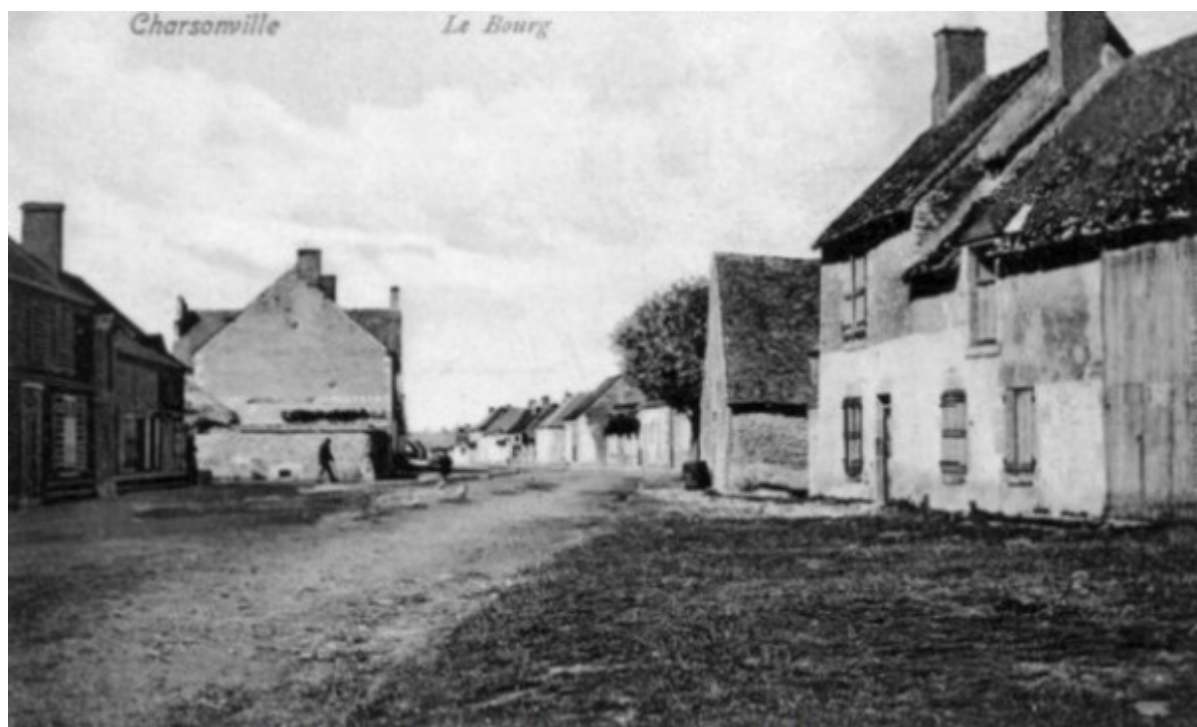
Les habitations existent toujours en extrémité de la place Maison abandonnée de Champenois à droite

Des anciennes habitations sur la place, la maison de Champenois, en mauvais état, avait été achetée dès le début du projet par la commune.