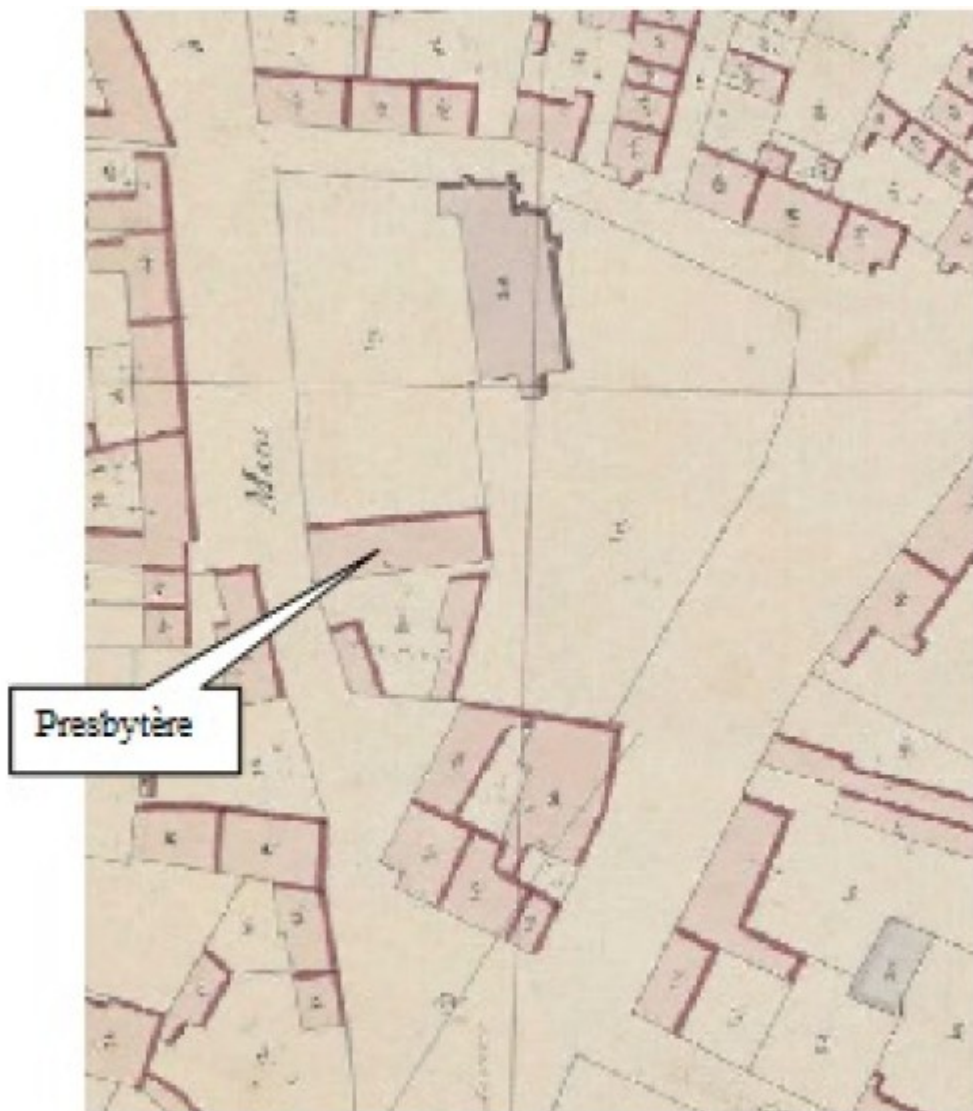
Plan de 1829 avant l'élargissement de la route principale

Mais le projet d'élargissement de la route « d'Orléans au Mans » nécessitait la démolition d'une partie du presbytère ou sa reconstruction totale. Ce projet, trop coûteux, ne verra jamais le jour et le presbytère fut démoli vers la fin 1904. Pour rappel, le presbytère avait été vendu par la commune en 1792, puis acheté par cette dernière en 1814 pour y loger le curé. A cette époque, le maire avait choisi de conserver une des chambres du presbytère pour y installer le local de la mairie avant la construction de la nouvelle école et mairie en 1850.