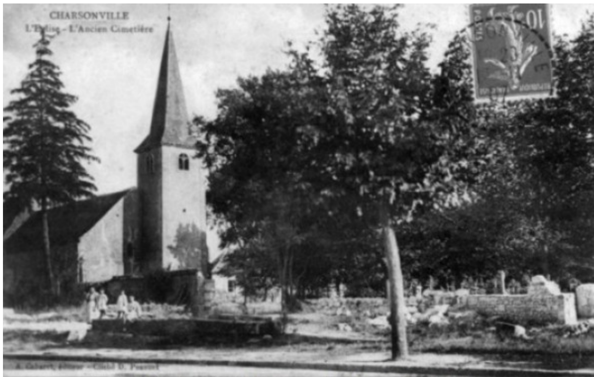
L'élargissement de la route côté place a été réalisé Le presbytère est démoli et son jardin a disparu On aperçoit encore des croix dans l'ancien cimetière