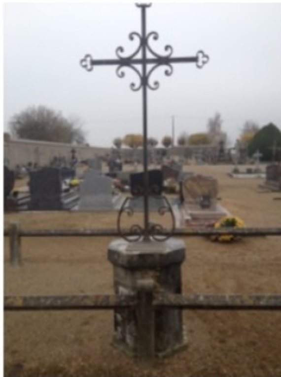
Ossuaire renfermant les restes mortels relevés en 1907 de l'ancien cimetière