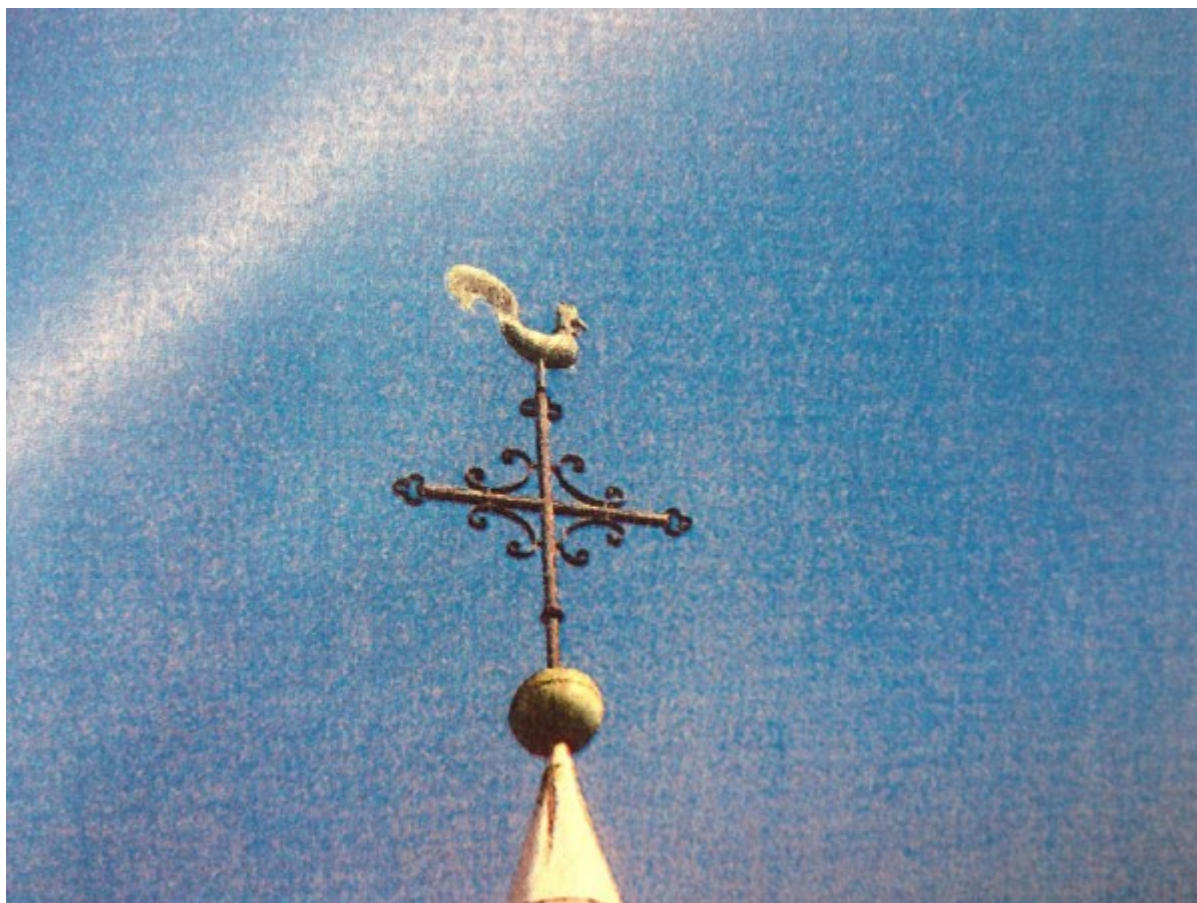
Croix au sommet de la flèche du clocher