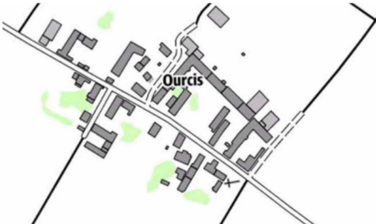
Carte IGN 2017