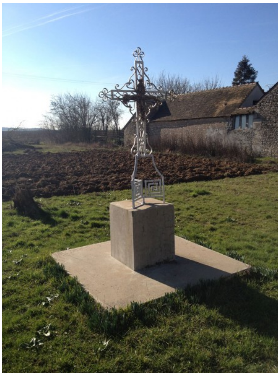
Croix buisée en 2019