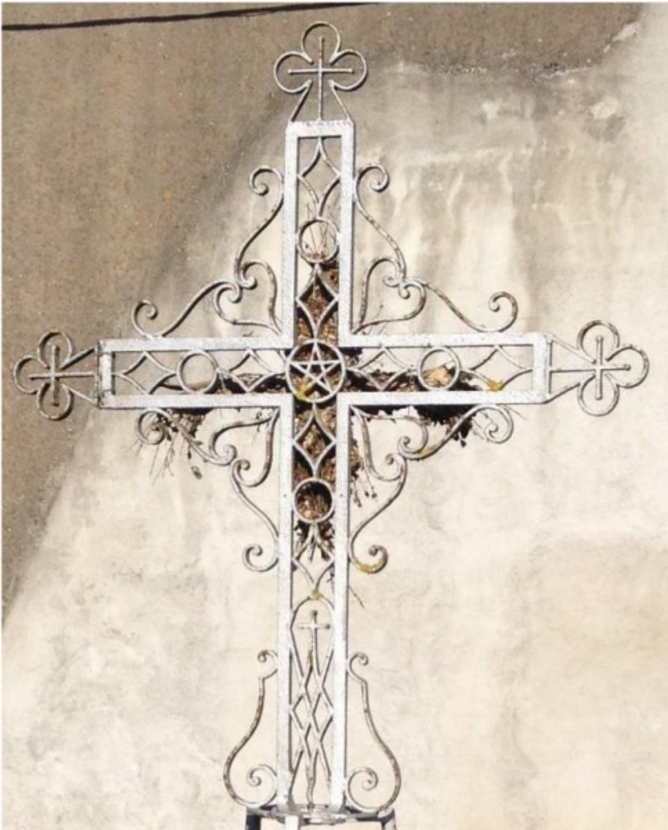
Croix évidée avec une étoile à cinq branches au Centre (Coté Sud)