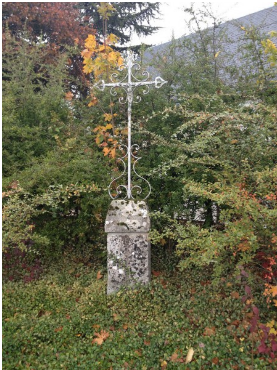
La croix en 2018