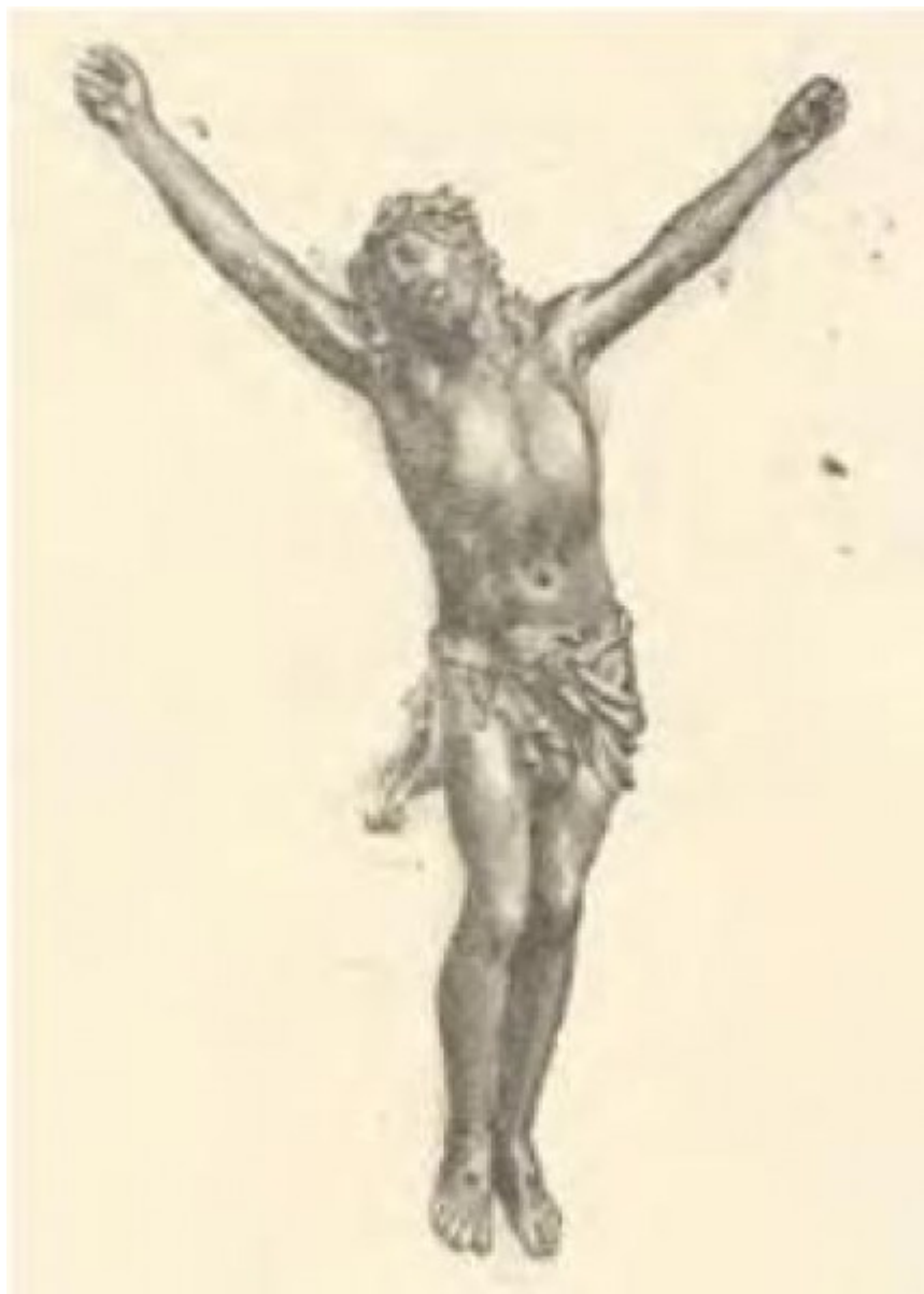
Christ d'après E.Bouchardon