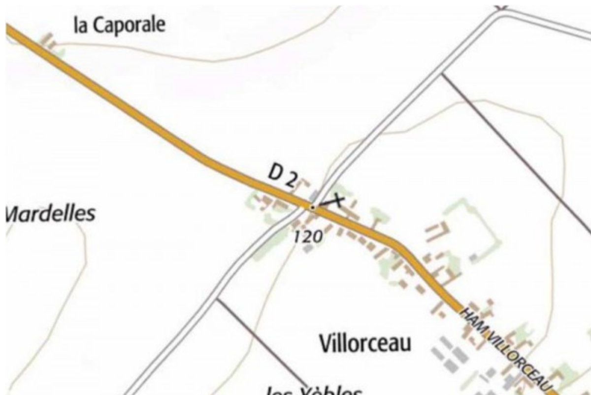
Carte IGN 2018