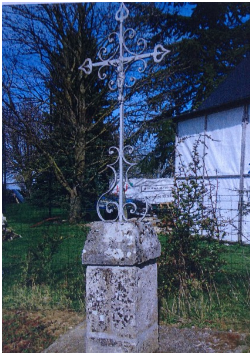
La Croix vers 2008