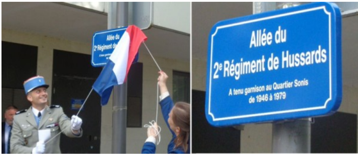
Après l'évocation de l'histoire du 2ème Hussard, la plaque dénommant cette Allée est dévoilée.