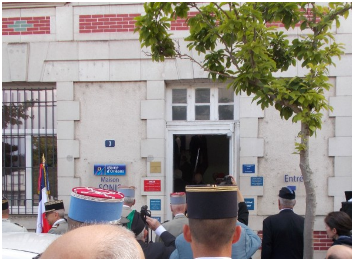
L'entrée de la Maison SONIS au N° 3 de l'allée du 2ème Régiment Hussards