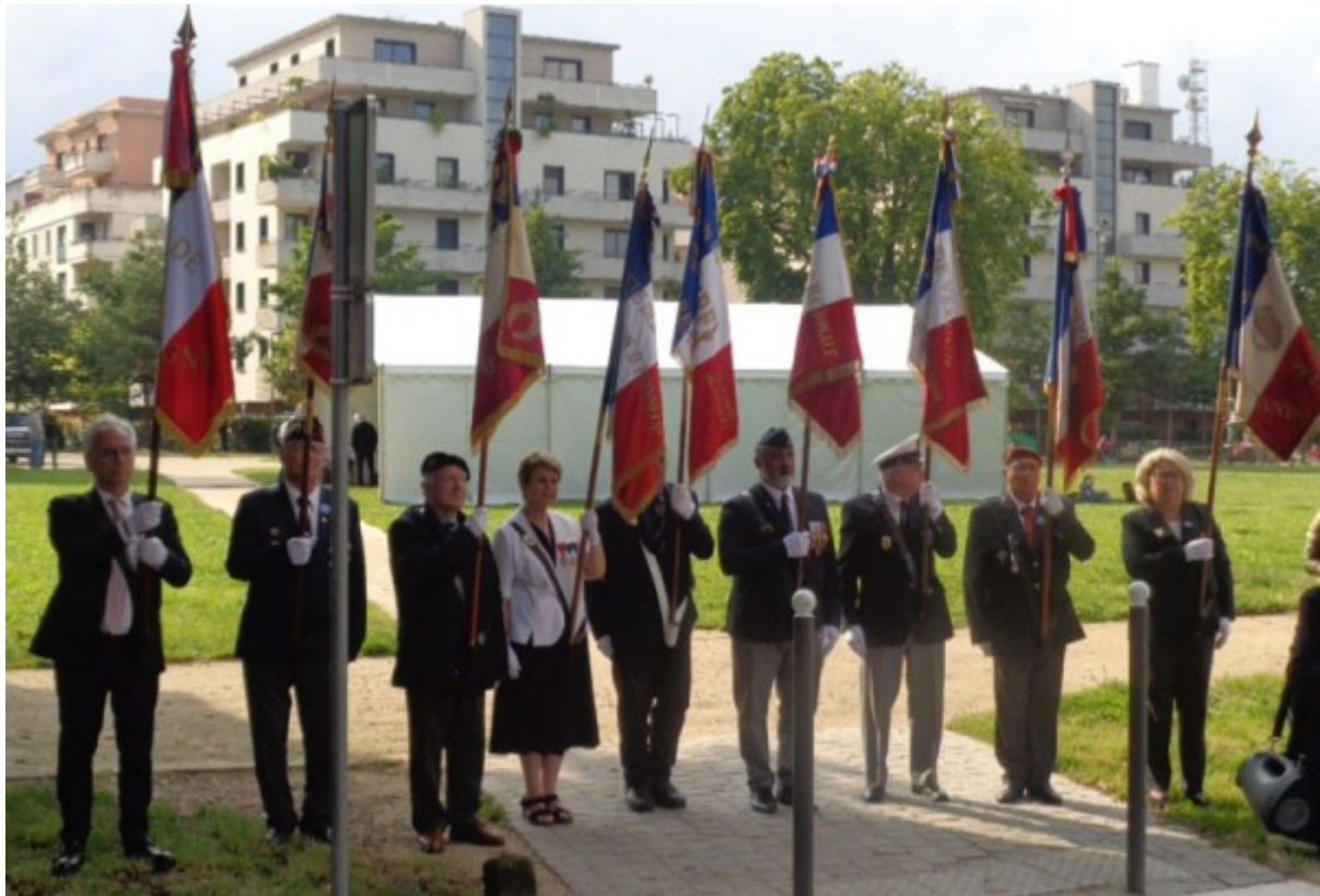
De nombreux drapeaux ont accompagné les différentes étapes de cette manifestation