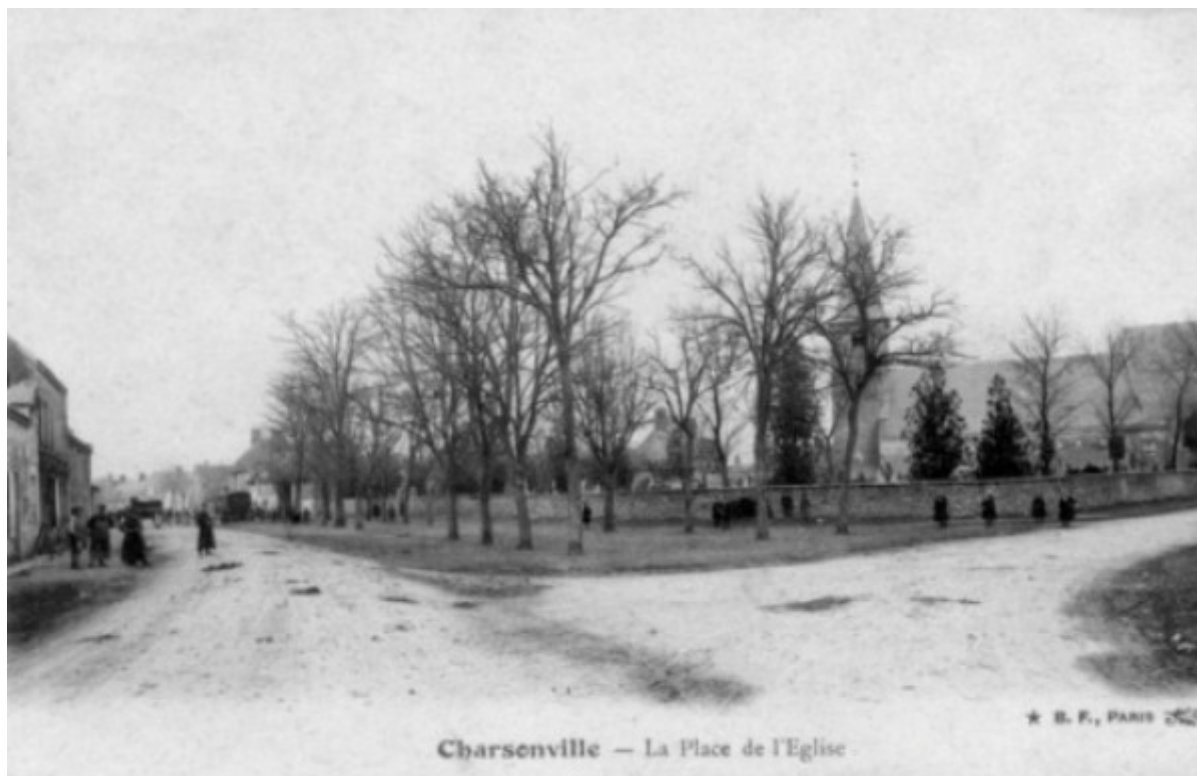
Le mur du cimetière côté de la place du marché et des fêtes

Le mur de clôture, côté place du marché, était de 2m en 2m pourvu de barbicanes destinées à favoriser l'écoulement des eaux pluviales qui, sans cette précaution, inonderaient le cimetière. Mais ces eaux, à cause de la différence de niveau entre le sol du cimetière et celui de la place (environ 1,80m), lavaient les sépultures et entraînaient sur la voie publique des liquides chargés de matières organiques en décomposition, les corps n'étant inhumés qu'à une profondeur maximum de 1,50m.