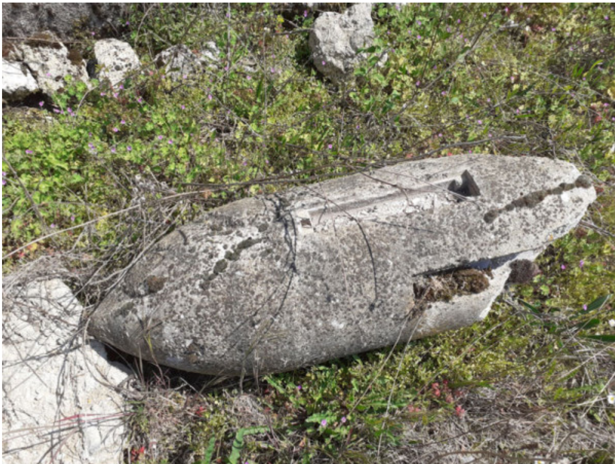
Une bombe en ciment larguée par les Américains

Une légende tenace veut qu'une nuit, les alliés bombardèrent ce faux camp avec des bombes en bois, en réalité seuls seront larguées quelques fausses bombes mais sur la piste, se moquant ainsi de l'occupant.