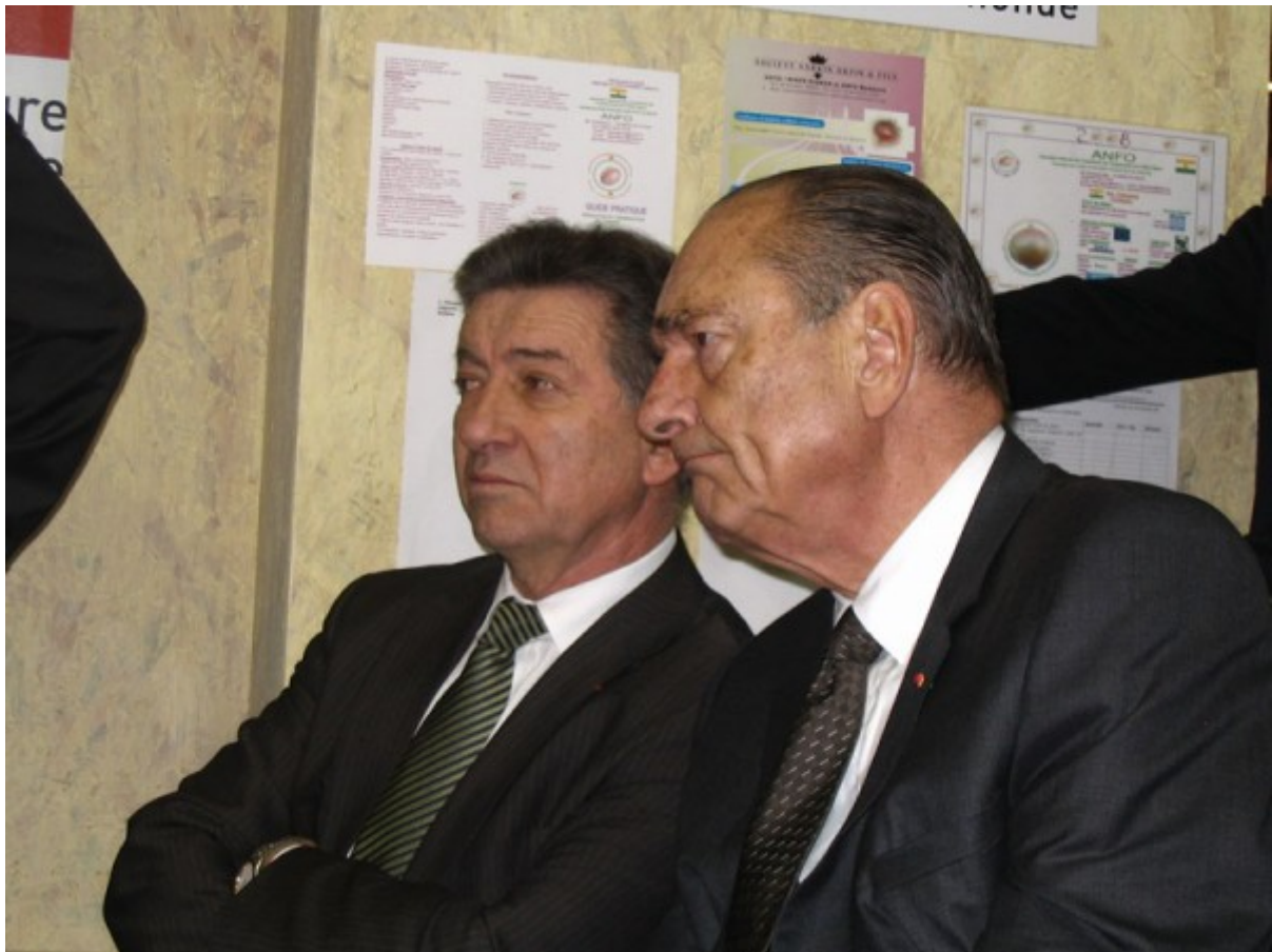
Attentif aux questions et témoignages