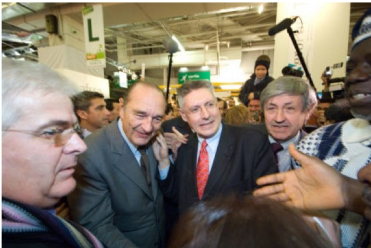
L'arrivée au stand est toujours un grand moment de bousculade

La galerie de photos ci- dessous constitue un témoignage que nous souhaitons partager avec nos visiteurs.