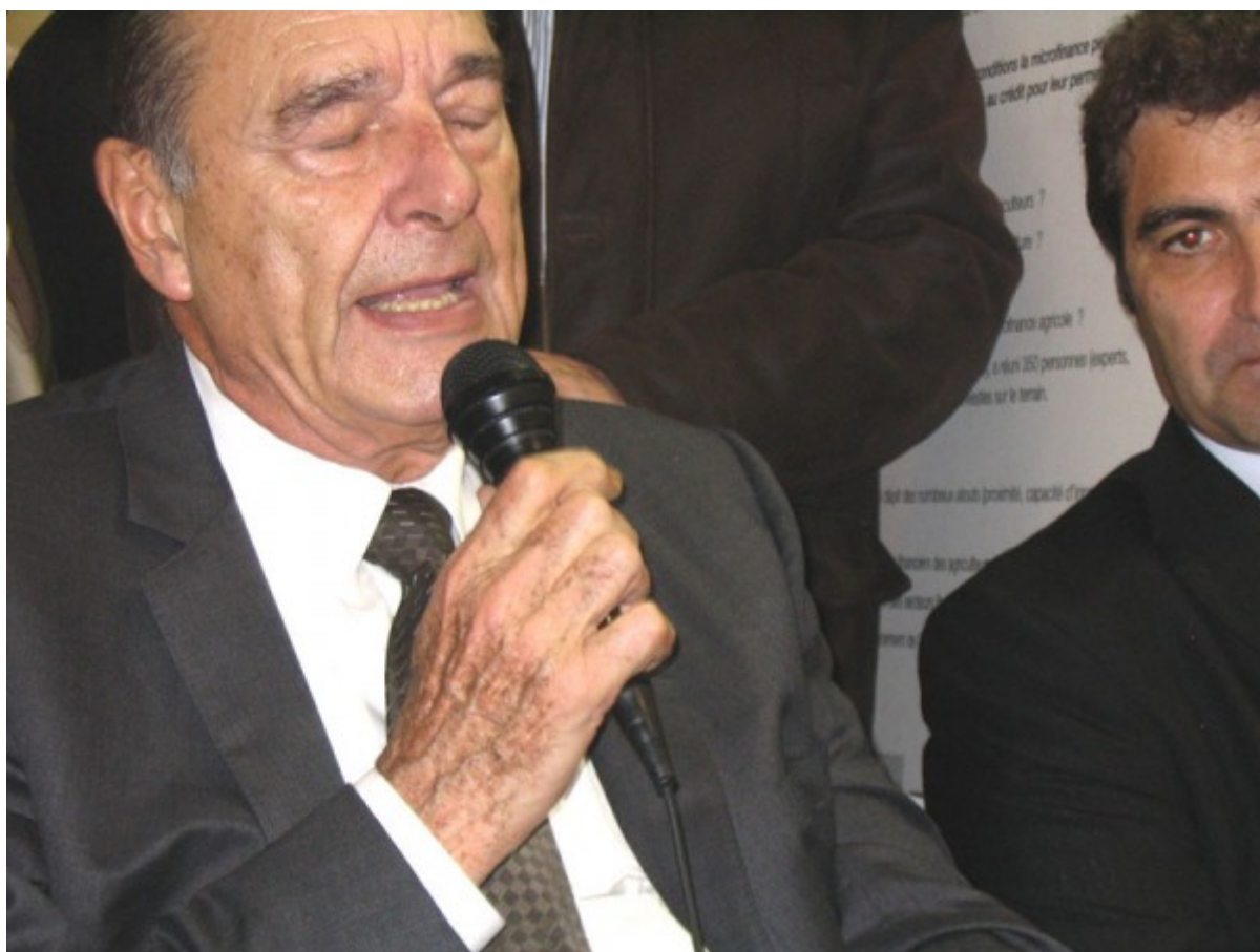
Reprise du micro. Il restera plus de deux heures à écouter et répondre