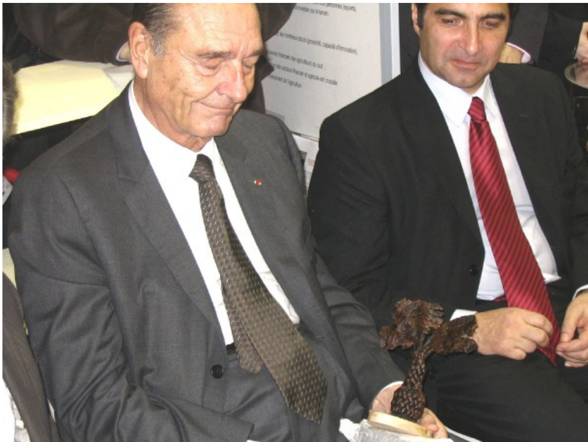
Dans ses mains un ravenale (l'arbre du voyageur) l'emblème de Madagascar réalisé en vanille tressée