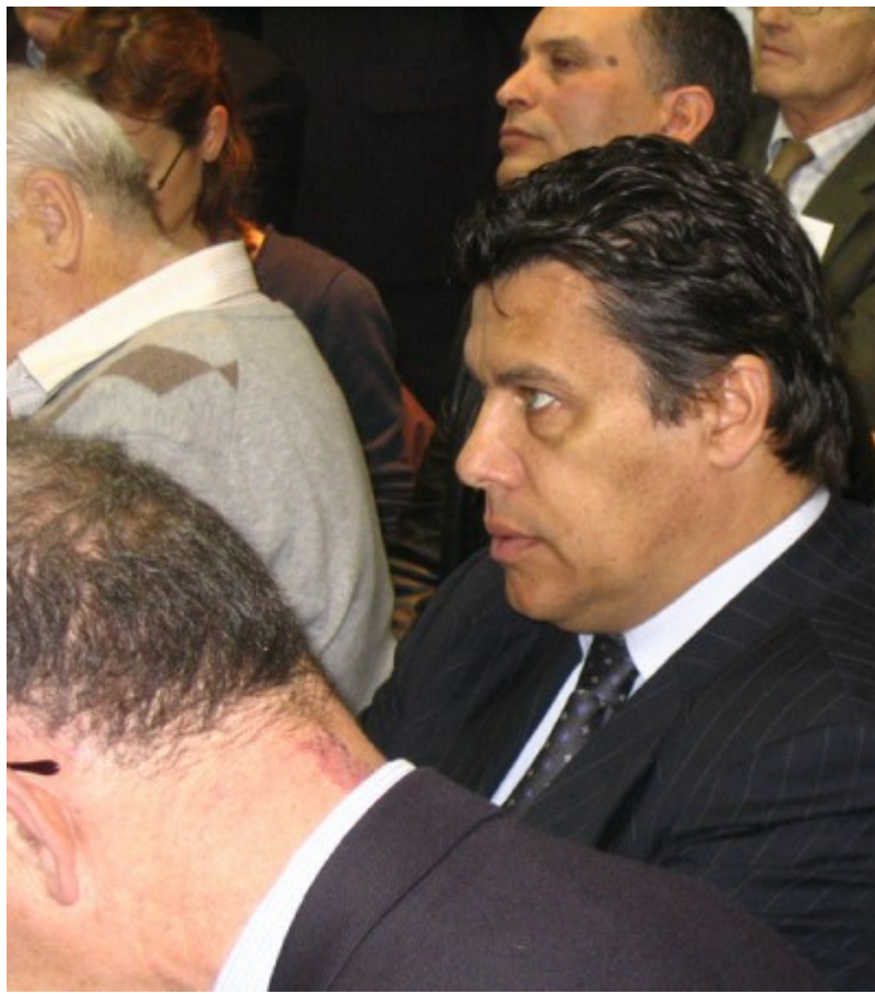
Parmi les auditeurs le président de la Chambre d'Agriculture du Loiret