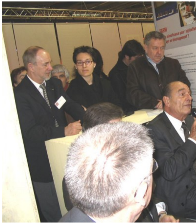
Au milieu de très nombreux curieux ou visiteurs.