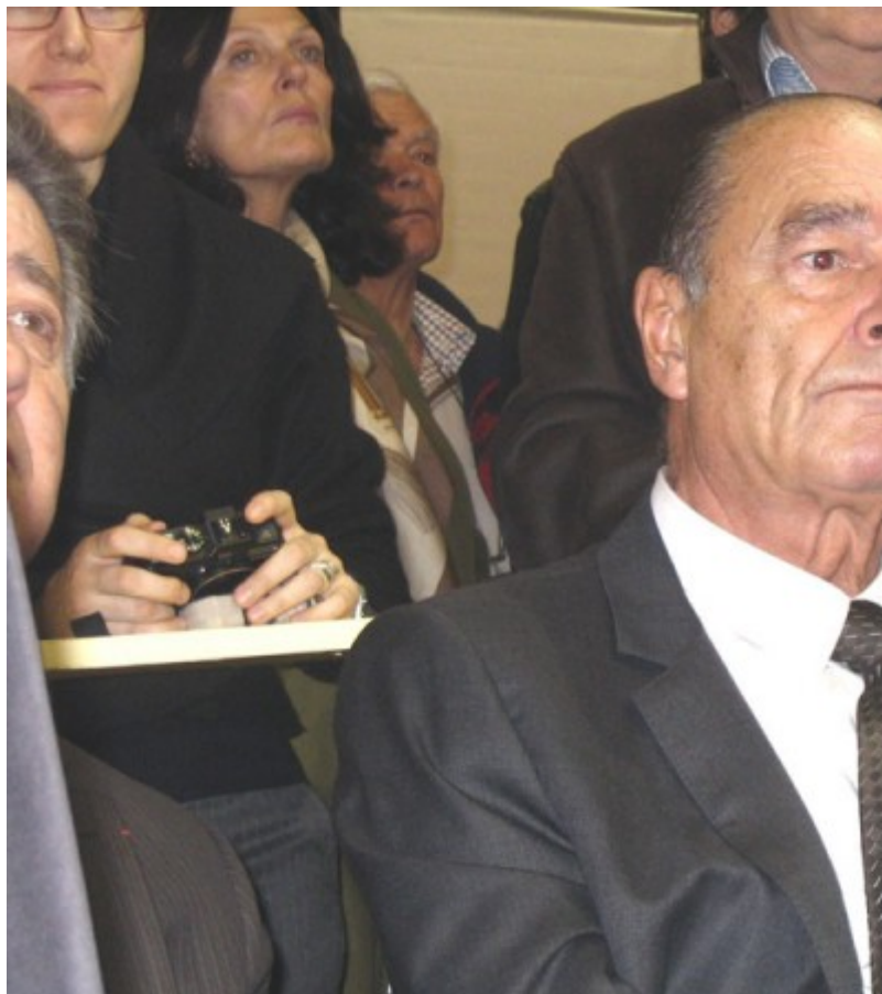
Une attention toute particulière