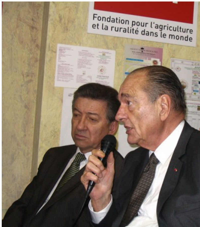
Jacques CHIRAC a tenu à répondre aux nombreuses questions qui lui ont été posées