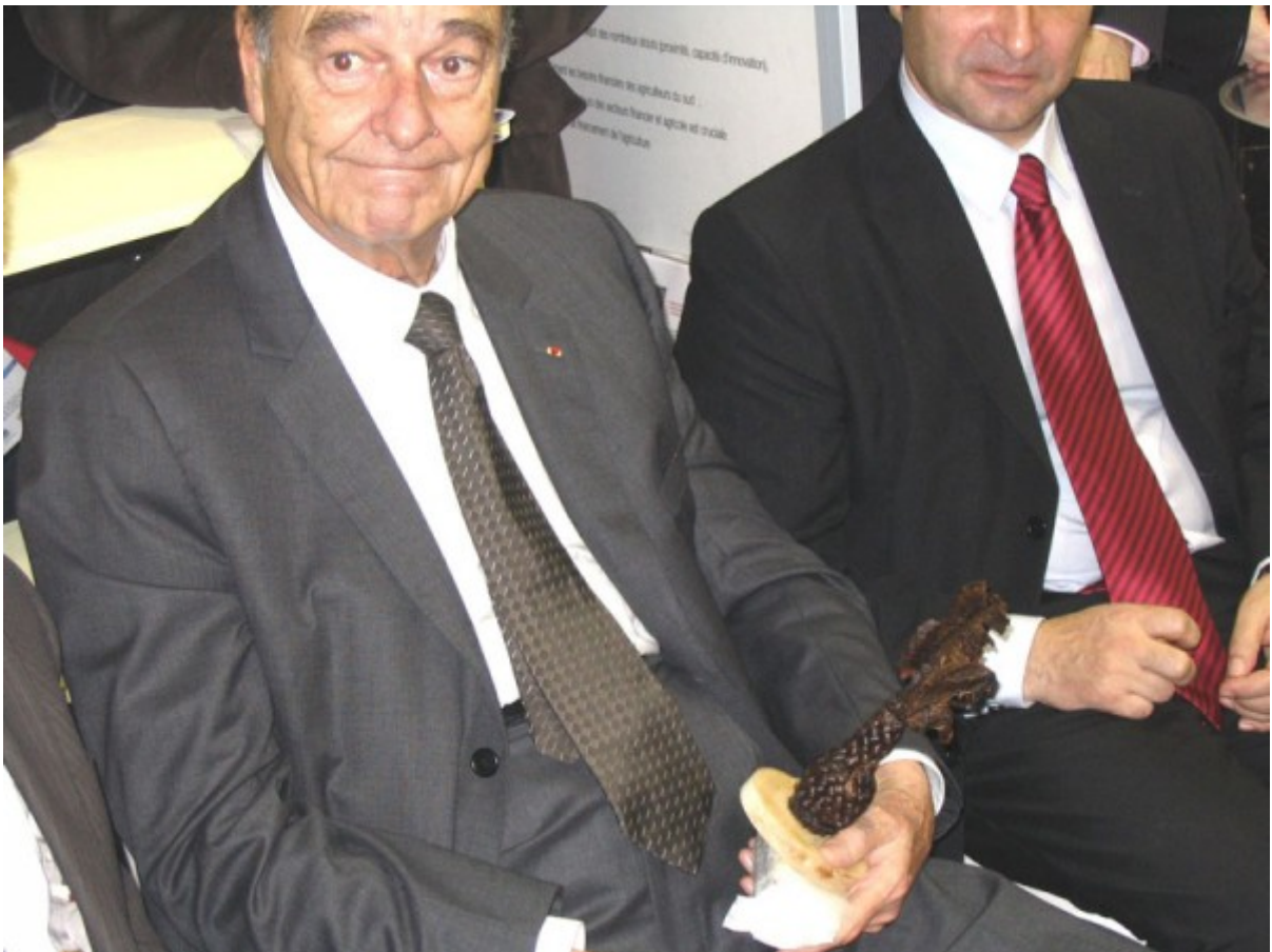
Ravis du cadeau qu'il vient de recevoir de la part des planteurs de vanille de Madagascar