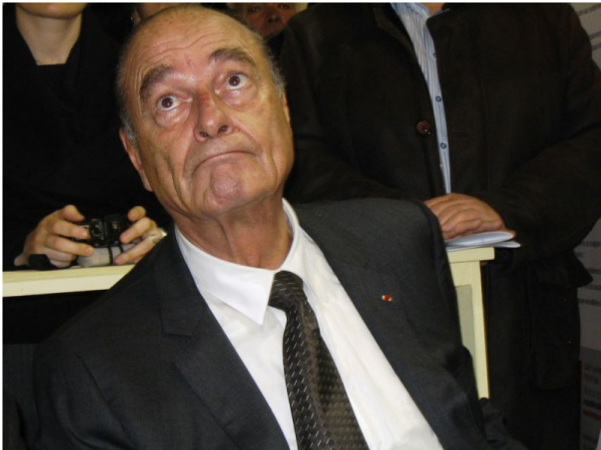
Un moment d'interrogation