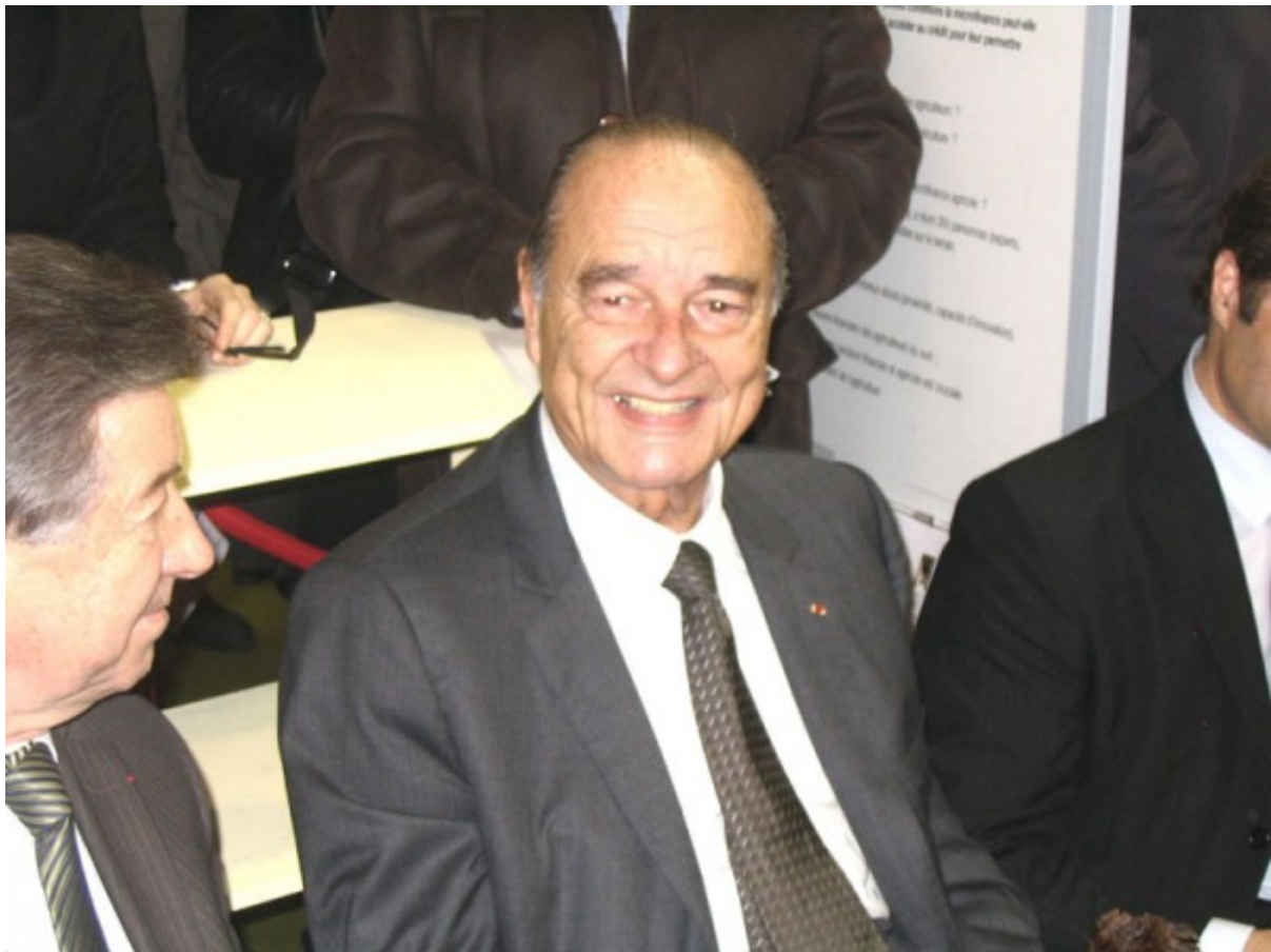
Un long moment de convivialité qui, visiblement ravi l'ancien ministre de l'agriculture